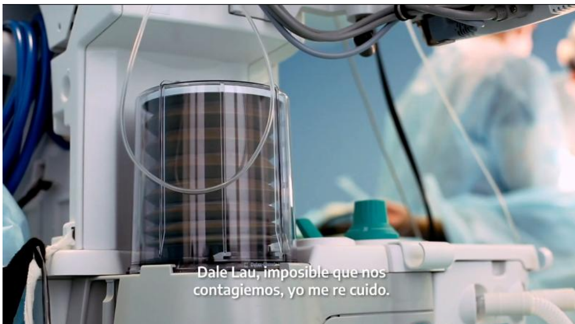
Figura 8. Fotograma. Argentina Presidencia, 2020i

Nos encontramos con un anuncio que muestra a personas en situación de internación hospitalaria, editadas juntamente a voces de ciudadanos que instan a reunirse, por diversas razones, incumpliendo el aislamiento social. Por ejemplo, ellos afirman “Es el cumple del viejo, ¿cómo que no vamos a hacer nada? ¡Son 70 pirulos!”; “Dale Lau, imposible que nos contagiemos, yo me recuido”; “Uso el permiso como que voy a buscar a mi mamá y voy para allá, olvidate, no pasa nada”. Estos enunciados contrastan con las imágenes que muestran a personas internadas y, en planos detalle, diversos elementos sanitarios como respiradores y sueros (Figura 8).