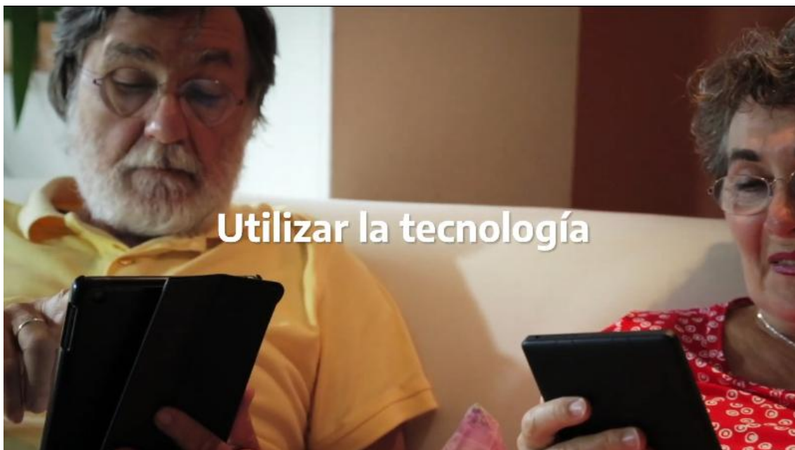
Figura 4. Fotograma. Argentina Presidencia, 2020d

Una voz en posición over recomienda una serie de acciones destinadas a sobrellevar la cuarentena, tales como acomodar el hogar, utilizar la tecnología para mantener la comunicación con los amigos y familiares, realizar ejercicios, leer, cocinar, entre otras. Cada una de estas recomendaciones es acompañada por una escena que expresa visualmente el enunciado verbal del narrador, a la vez que un paratexto sobre imprime en la pantalla las palabras clave de dichos enunciados (Figura 4).