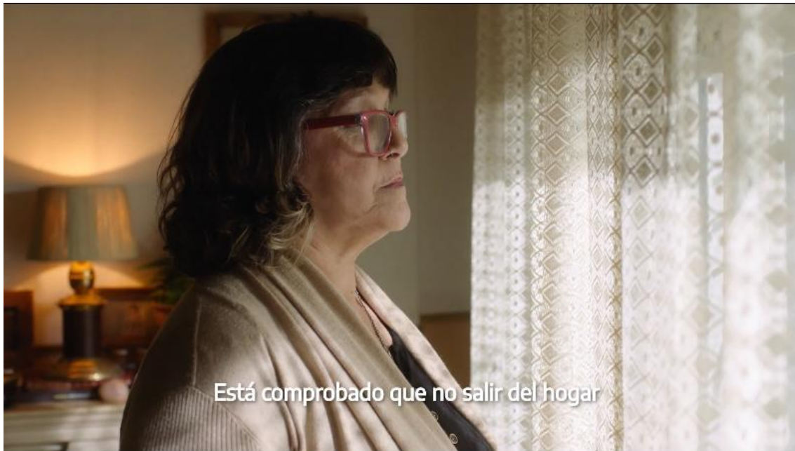
Figura 2. Fotograma. Argentina Presidencia, 2020b

En suma, el aviso contiene imágenes de ciudadanos que no presentan más especificidad que su edad, sexo y ocasionalmente su ocupación laboral (Figura 2).