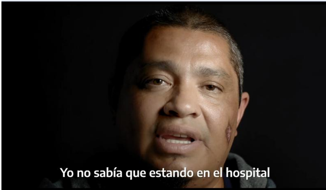
Figura 9. Fotograma. Argentina Presidencia, 2020k

La exhibición de los relatos de los ciudadanos, ubicados en un fondo neutro color negro, constituyen materias de significación equivalentes a las mostradas en Seamos responsables : la estética de ambos spots busca representar una realidad con la menor intervención del aparato tecnológico.