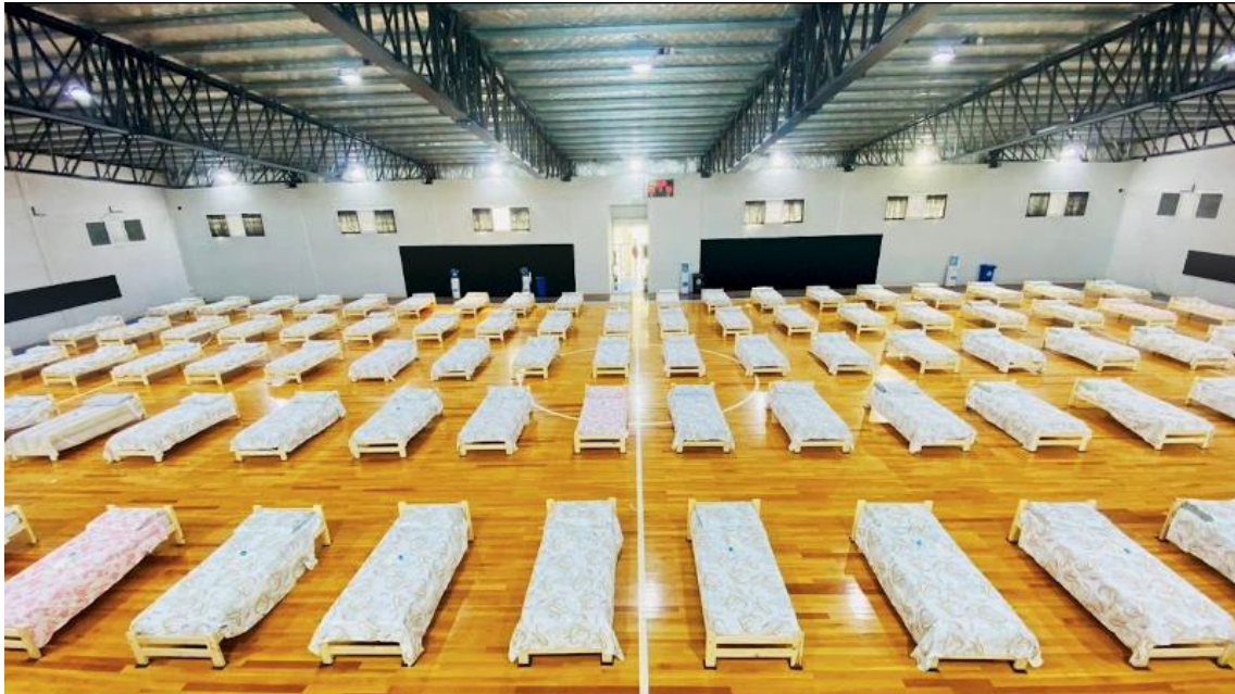
Figura 5. Fotograma. Argentina Presidencia, 2020e

de diseño se recurrió a un procedimiento denominado asociación por analogías (Casetti & di Chio, 2014) el cual consiste en vincular las imágenes en movimiento en razón de alguna clase de elemento similar que en éstas se reitere. En nuestro caso, el aviso se conforma por un conjunto de planos largos y medios, los cuales muestran espacios cerrados ocupados con camas destinadas al uso de internaciones por Covid-19 (Figura 5). Dos paratextos, dispuestos sobre el final del anuncio, indican Queremos que nadie las necesite y Quedate en casa .