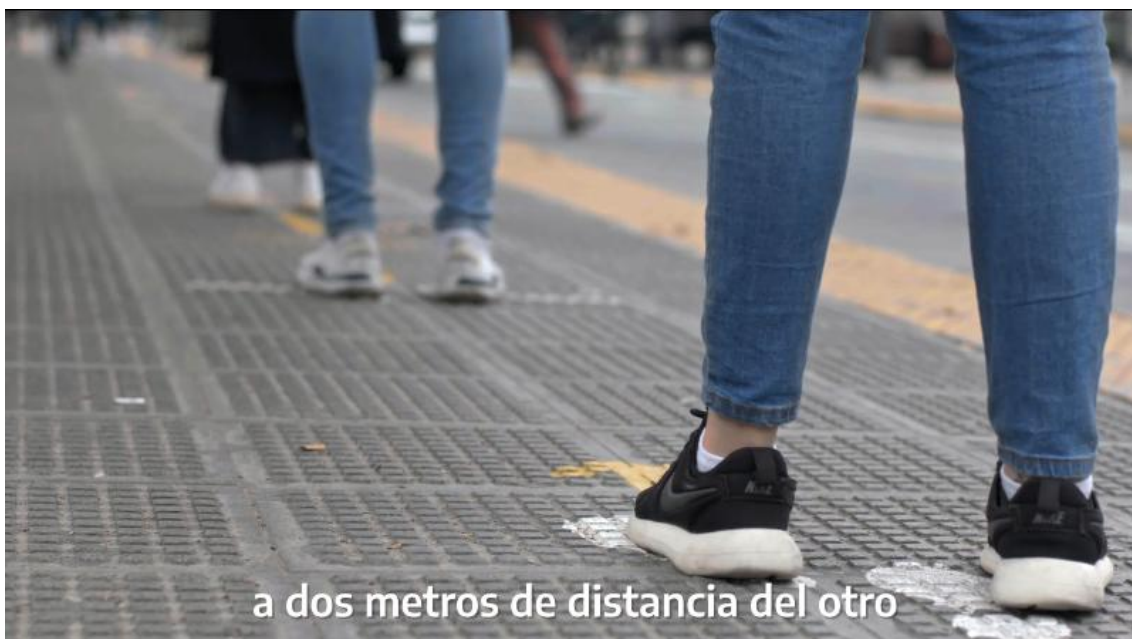
Figura 7. Fotograma. Argentina Presidencia, 2020h

Pasado un mes, el 21 de julio otro anuncio, titulado Respetá el distanciamiento social (Argentina presidencia, 2020h. Duración: 00:32), refuerza el programa argumental anterior, al promover las medidas de cuidado sanitario. Las imágenes refrendan a la voz over , mostrando distintas situaciones que dan un cuerpo visible a sus enunciados. En efecto, el plano detalle de piernas (Figura 7) constituye una sinécdoque cinematográfica (Gubern, 1987), que muestra, en este caso, la parte por el todo de las personas que aguardan en la calle manteniendo la distancia social.