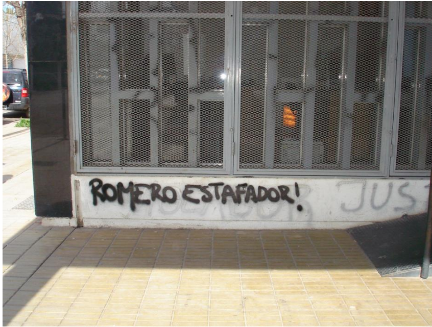
Fuente: foto tomada en protesta en el Juzgado Civil de Cipolletti