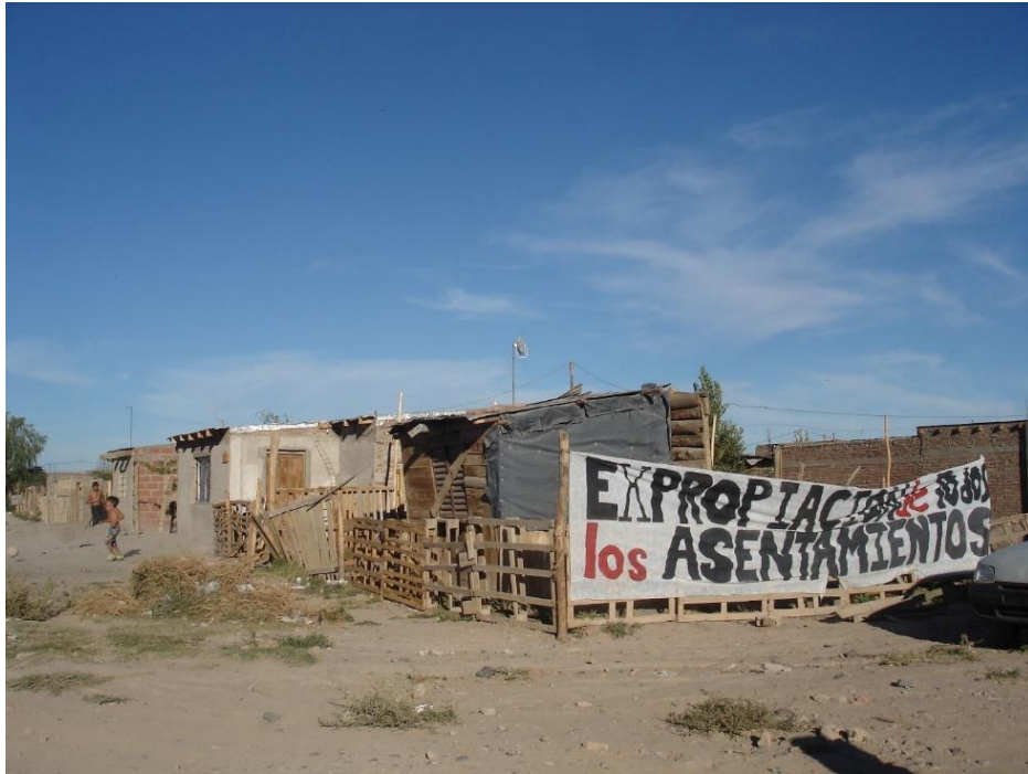
Foto tomada en festival cultural en el B° Obrero contra el desalojo