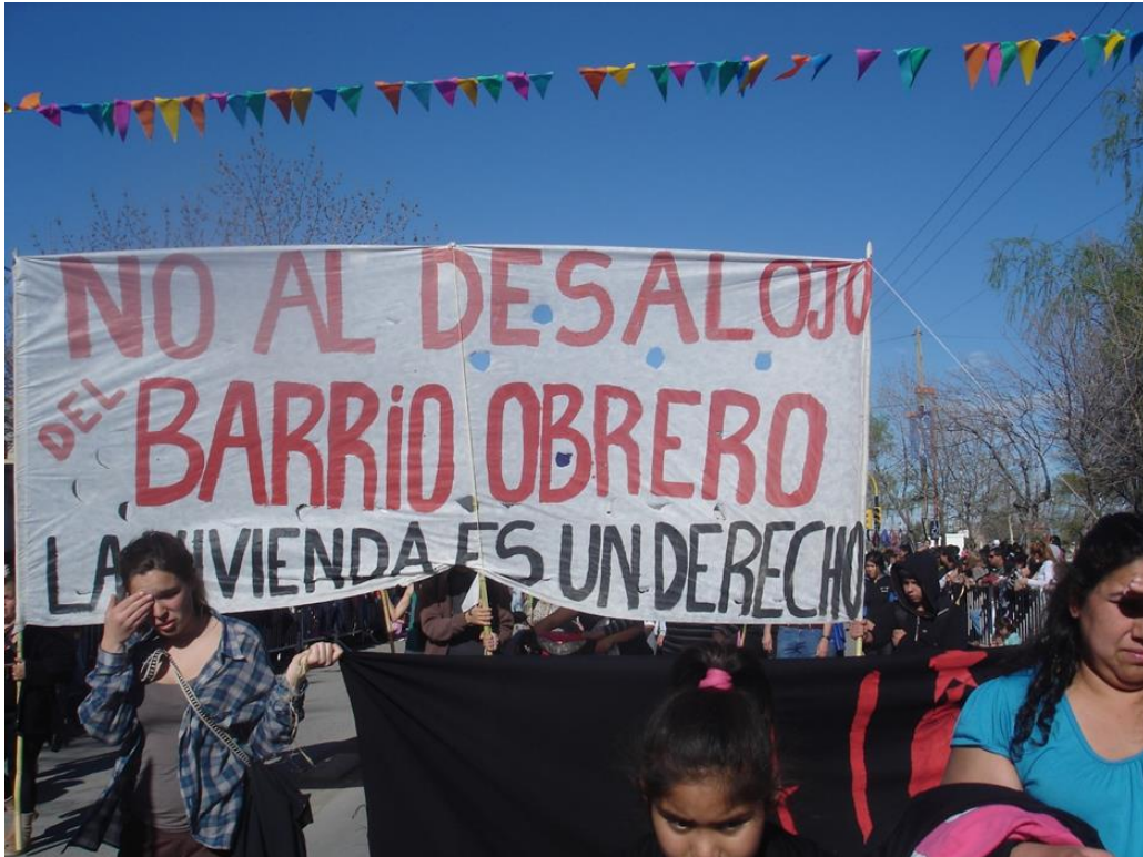
Foto tomada en manifestación contra el desalojo del B° Obrero en desfile por el aniversario de la ciudad de Cipoletti.