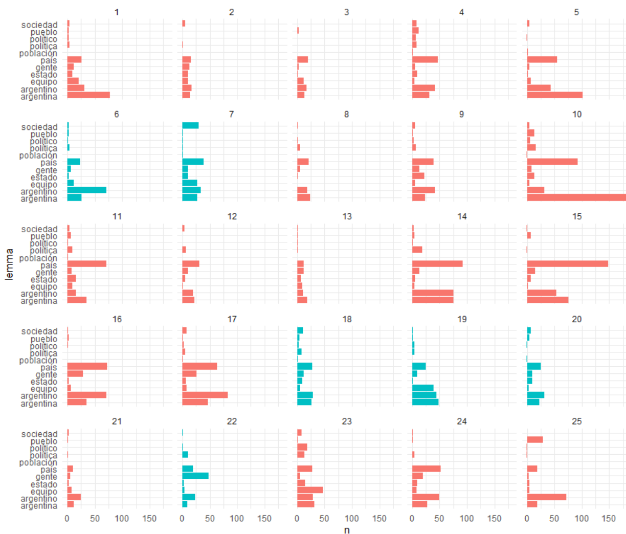
Gráfico 2. Incidencia de ciertas palabras en oraciones representativas de cada tópico

En lo que sigue de esta sección nos referimos a cada tópico, describiendo el campo de oraciones que hemos relevado a partir del muestreo realizado, y vinculándolo con las interpretaciones de Ciardiello (2018, 2019, 2021) sobre el discurso de Macri.