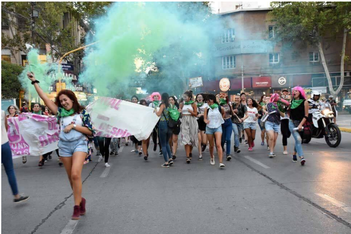
- Intervención III, año 2016