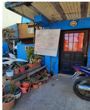
Almacén del barrio El Ceibo, 2021.