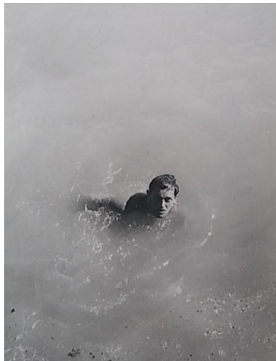
Vecino del barrio Enamour nadando en el Río de La Plata, 1964.

Respecto al estado del río y su costa, comenta que el agua “no siempre estuvo tan sucia como ahora”. Desde su experiencia como pescador, explica que aunque siempre hubo contaminación, los peces abundaban y luego fueron disminuyendo, los vecinos y foráneos durante el fin de semana nadaban; “nadaban tanto que tirábamos el esquivel”, apunta que no fue hasta la década del 80 del siglo pasado que la municipalidad prohíbe a los vecinos nadar en el río. También, señala que la desembocadura de las cloacas en el canal Bermúdez ocurrió entre el 63 y el 66.