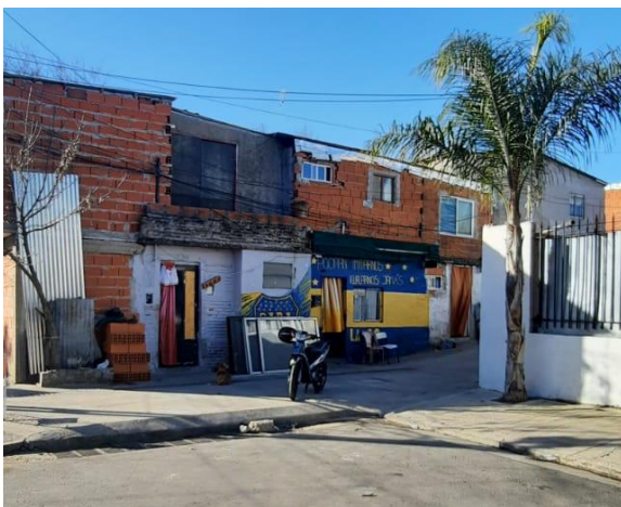
Casillas del barrio El Ceibo, 2021.

La entrevista transcurre en la calle, no asfaltada, un mediodía soleado, interrumpidos o acompañados por ladridos, chicos que juegan a la mancha en la calle junto a nosotros, pescadores que ofrecen mercadería de manera ambulante, y vecinos que nos saludan al pasar. Las viviendas son en su mayoría coloridas, las que no tienen murales futboleros o imágenes de algún cura villero, están pintadas de colores aleatorios o cubiertas por ladrillos y cemento, a medio construir.