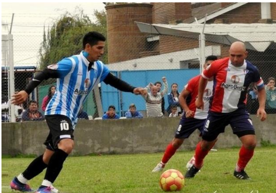
Clásico en “El matadero”. Año 2016. Se pueden diferenciar camisetas “titulares” de ambos equipos. San Martín, franjas verticales celestes y blancas. Matienzo tres franjas: rojo, blanco y azul.