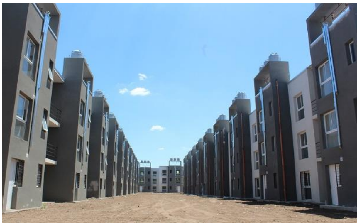
Imagen 4. Ibarlucea Este

patio. Las tipologías son de tres tipos: planta baja, dúplex y triplex de carácter evolutivo, lo que les permite a las familias adjudicatarias realizar futuras ampliaciones.