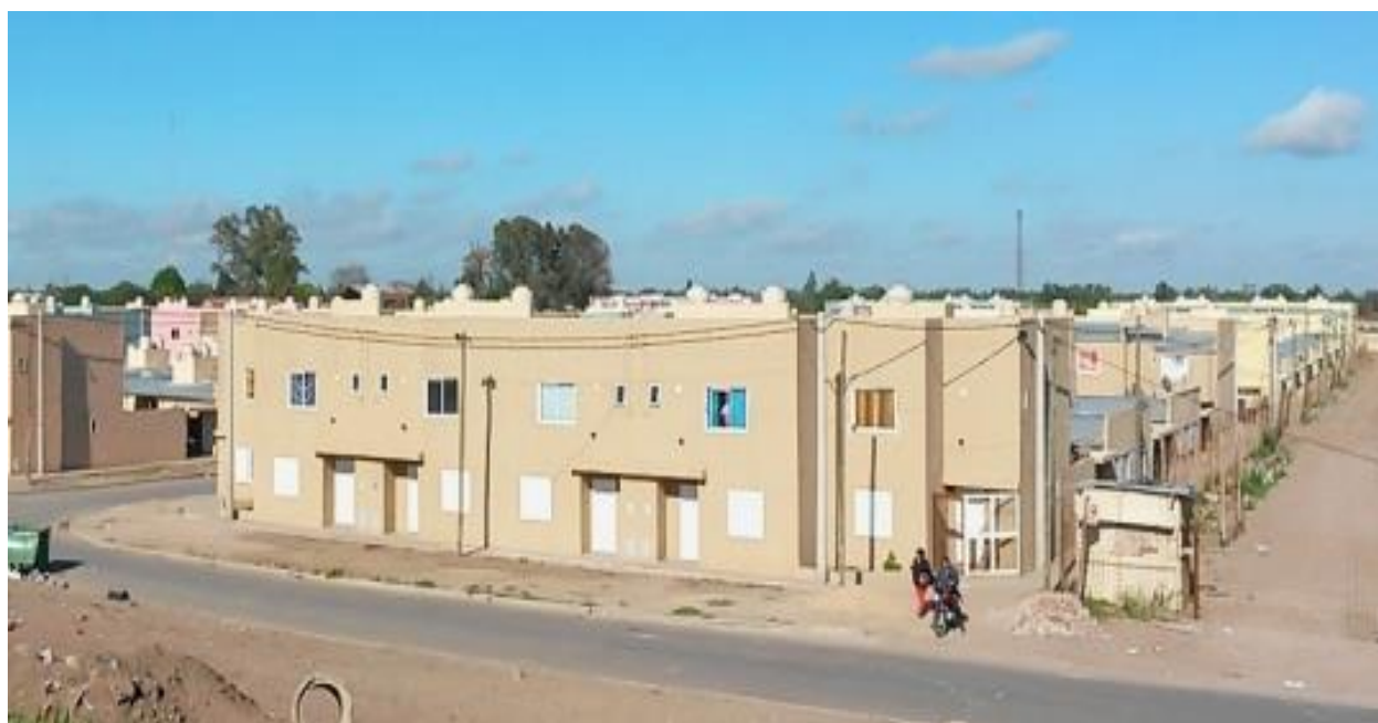
Imagen 2. Barrio Empalme

"el gobierno provincial cumple con la responsabilidad y el deber de garantizar el acceso a la primera vivienda propia, a familias de trabajadores. Creemos que la responsabilidad de las familias no solo debe ser cumplir con el pago de las cuotas, sino también con el reglamento de usufructo de las viviendas sociales, es decir, los grupos familiares adjudicados tienen que habitar las casas; no las pueden vender ni alquilar" (Gobierno de Santa Fe, 2018: 1).