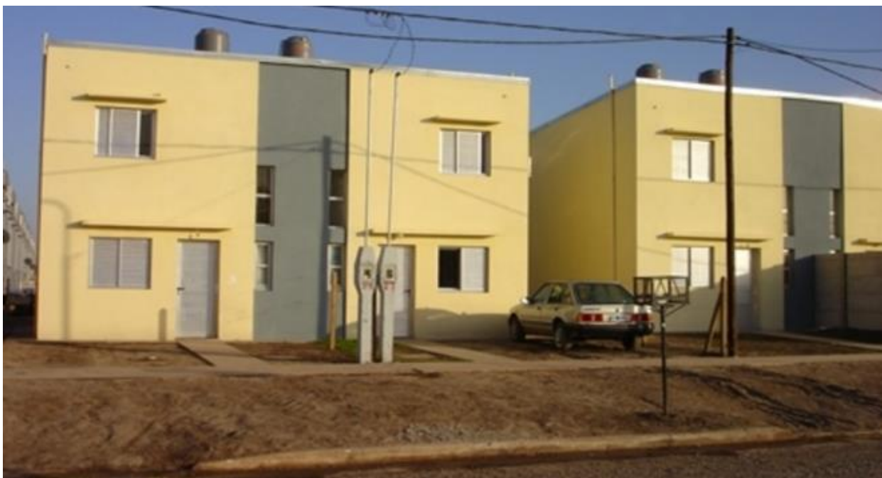
Imagen 1. Barrio Docente

La edificación es con el sistema de construcción tradicional, en donde cada unidad habitacional posee entre 50 y 63 m 2 cubiertos, de acuerdo al prototipo empleado dúplex y planta baja, distribuidas en dos dormitorios, baño, cocina – comedor y patio.