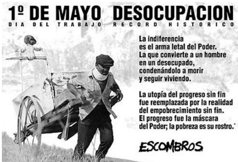
Desocupación de Grupo Escombros → Arte Político