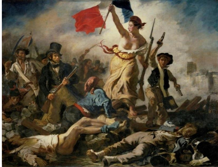
El 28 de julio. La Libertad guiando al pueblo de Eugene Delacroix → Romanticismo

Esta discusión va a repetirse sin cesar y se sigue desarrollando en nuestra actualidad. Daré dos ejemplos más para no tornarme muy repetitiva: por un lado, los intrincados significados ocultos del arte conceptual versus la aparente nada significativa del minimal, y por el otro, la pretendida obligación moral del arte de politicidad explícita (como si existiera arte no político) contra el supuestamente relajado y naif arte light. Contra lo que tan fervorosamente defendiera Frank Stella, en el arte nada, absolutamente nada, es lo que se ve.