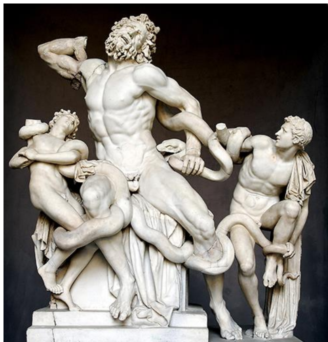
Laocoonte → Período Helenístico