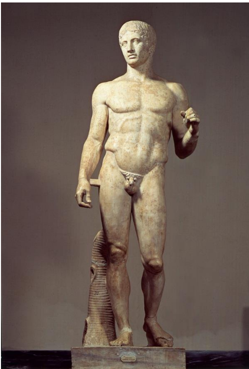
Doríforo de Policleto → Período Clásico

Por fortuna, y para comodidad de todos los historiadores del arte, los griegos se pusieron de acuerdo y dedicaron un par de siglos a cada una: el período clásico (S V - IV a.C.) al ethos y el helenístico (S III - II a.C.) al pathos .