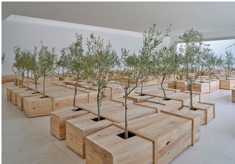
Ex It de Yoko Ono → Arte Conceptual

Esta discusión va a repetirse sin cesar y se sigue desarrollando en nuestra actualidad. Daré dos ejemplos más para no tornarme muy repetitiva: por un lado, los intrincados significados ocultos del arte conceptual versus la aparente nada significativa del minimal, y por el otro, la pretendida obligación moral del arte de politicidad explícita (como si existiera arte no político) contra el supuestamente relajado y naif arte light. Contra lo que tan fervorosamente defendiera Frank Stella, en el arte nada, absolutamente nada, es lo que se ve.