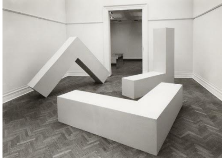
Sin Título (Vigas en L) de Robert Morris → Minimal