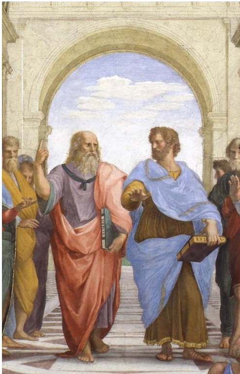
La escuela de Atenas de Rafael Sanzio (detalle de Platón y Aristóteles)

Mientras tanto, en el campo de la filosofía, nuestros afamados Platón y Aristóteles discutían si era preciso desestimar nuestros sentidos en pos de afirmar las ideas o conceptos de las