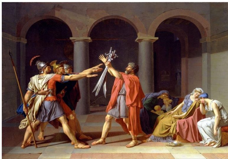
El Juramento de los Horacios de Jacques-Louis David → Neoclasicismo

De esta manera, discutiendo si nos conviene pensar o sentir, llegamos hasta el complejo siglo XVIII, el "Siglo de las Luces", donde el rechazo a los lujos monárquicos barrocos provocará la adopción de los supuestos valores republicanos romanos y democráticos griegos. Y digo supuestos porque ni los griegos tenían una auténtica democracia ni los romanos gozaban de una verdadera república. Pero, aunque errónea, esta idea inspirará toda clase de concepciones acerca de los antiguos y, en especial, aquella ilusión en la que eran los grandes intelectuales de la Historia. Entonces, en respuesta a la "oscura" irracionalidad previa, los pensadores y artistas alzarán la "luz" de la Razón, y el Racionalismo resultante dará justamente "a luz" al Neoclasicismo, para que plasme en el arte todo aquello que afloraba en la filosofía.