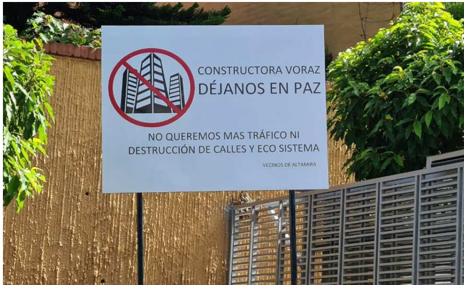
Figura 2: “Constructora voraz, déjanos en paz”, valla de vecinos, San Salvador.

En las últimas dos décadas las capitales centroamericanas han entrado en un proceso de densificación, asociado al agotamiento de los suelos urbanizables en periferia y a la valorización del suelo en áreas bien ubicadas. Esto fue una de las motivaciones iniciales para la formulación del POT de Guatemala que buscaba promover la densificación y vincularla a la disponibilidad de infraestructura y transporte público. No obstante, la “verticalización” ha suscitado numerosas disputas con vecinos en zonas tradicionalmente residenciales que reclaman a la municipalidad: la pérdida de privacidad, la llegada de actividades nocivas, el aumento del tráfico vehicular y la sobre carga de las infraestructuras. Lo mismo se ha producido en el AMSS donde el PDT busca impulsar la densificación y la mixtura de usos, en oposición a la expansión y a la zonificación mono funcional tradicional. Ello ha generado disputas entre las municipalidades, OPAMSS, empresarios y vecinos de barrios privilegiados (Altamira, San Francisco) que buscan impedir la instalación de oficinas y edificios de apartamentos lo que incluso ha escalado a nivel de demandas judiciales, como se ilustra en la figura 2.