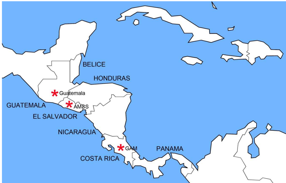
Figura 1: Centroamérica, casos de planificación en tres capitales

Centroamérica es todavía en la segunda década del siglo XXI la región menos urbanizada de América Latina. De acuerdo al Informe Estado de la Región (PEN-CONARE, 2021) 62% de los centroamericanos habitan en ciudades contra más de un 80% en la región latinoamericana. No obstante, durante las dos primeras décadas de este siglo Guatemala, Honduras, El Salvador, Nicaragua y Costa Rica (ver Figura 1) han experimentado una intensa actividad de planificación del territorio en diferentes niveles: nacional, sub nacional, municipal e incluso a nivel supra nacional centroamericano.