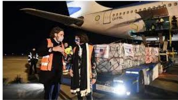
Recepción de vacunas donadas por EEUU

Hay una noción más aun en la donación y es el de la solidaridad, así la antropóloga brasileña Peirano (1996:15) 16 realiza en sus textos diálogos entre diversos aspectos de las ciencias sociales la que me interesa remarcar es la de Céli Regina Jardim Pinto, que piensa que con la teoría liberal que produce el sujeto político 'que coincide con el individuo', pero además sus textos ofrecen relacionar la política a la cultura y la ciudadanía en mosaico con la solidaridad. Y así proponerse desarrollar teoría de ¿qué tipo de sujeto construye la "solidaridad?" esta solidaridad también fue ejercida en algunos posts bajo la leyenda “la salida es colectiva” “vacunarse es un acto de amor y solidaridad” que empezó a aparecer en mayor medida cuando las personas que se vacunaban eran cada vez menos y había que convocarlas.