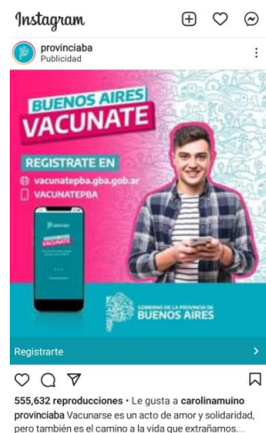
Vacunación a menores con donación/ Convocatoria publicitaria a vacunarse

231 Me gusta apepebahia EMPIEZA LA VACUNACIÓN DE MENORES DE 18 Mañana se van a distribuir 901.040 dosis de la vacuna #Moderna, del total de 3.500.000 que fueron donadas. Los criterios para vacunar a menores de entre 12 y 17 años son: